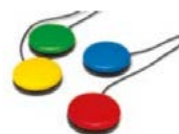
1685 / 1686 / 1687 / 1690