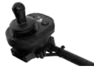
2231 / 2232