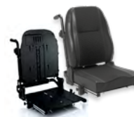
Rücken: ARM 2172 bzw. 2173