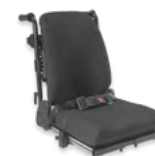
Rücken: ARM 2174, 2175