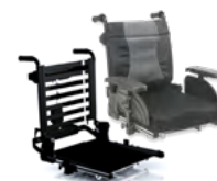
Rücken: ARM 2171