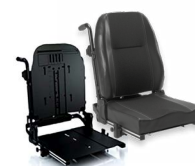
Rücken: ARH 2172 bzw. 2173