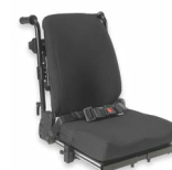
Rücken: ARH 2174, 2175