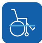
Gesamtlänge inkl. Beinstützen ▼