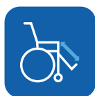
Länge der Beinstützen ▼