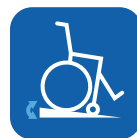
Maximale Neigung zur Verwendung der Feststellbremse ▼