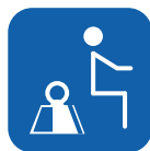
Max. Benutzergewicht ▼